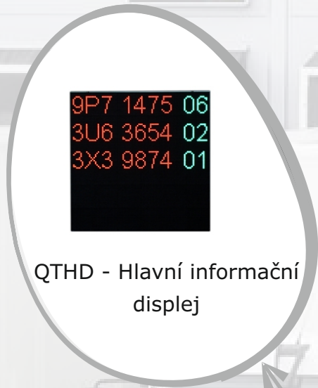
QTHD - Hlavní informační displej