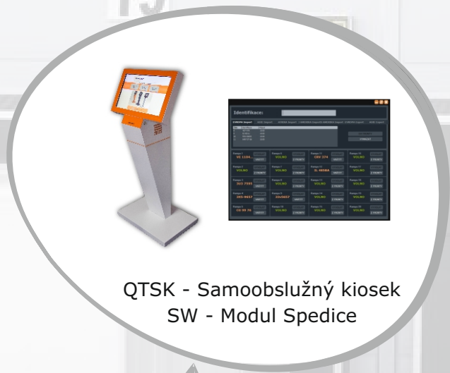
QTSK - Samoobslužný kiosek SW - Modul Spedice