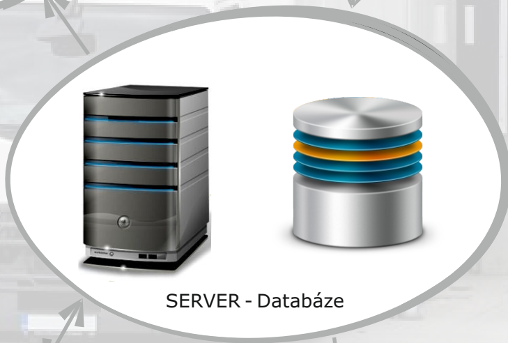
SERVER - Databáze