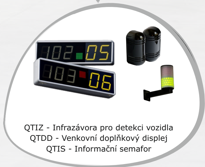
QTIZ - Infrazávora pro detekci vozidla QTDD - Venkovní doplňkový displej QTIS - Informační semafor